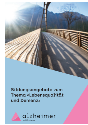
Flyer «Version Uri»

Flyer-Bestellungen per eMail info@alzheimerurischwyz.ch ; bitte die Lieferadresse, die gewünschte Anzahl und die Version [Uri oder Schwyz] angeben.