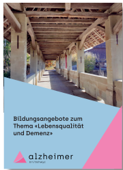
Flyer «Version Schwyz»

Seit 2022 bieten wir Schulungsangebote für Mitarbeitende aus dem Dienstleistungssektor an. Erfreulicherweise wurde unser Bildungsangebot von beiden Kantonen mehrfach gebucht. Das Feedback war stets positiv. Unser Bildungsangebot können wir damit weiterhin anbieten.